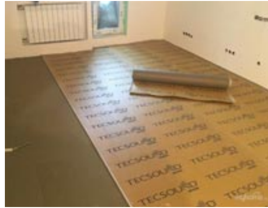
Tecsound 70 SY avtak dekkplast- , videre Tecsound på gulv, SY på vegg og SY i tak.