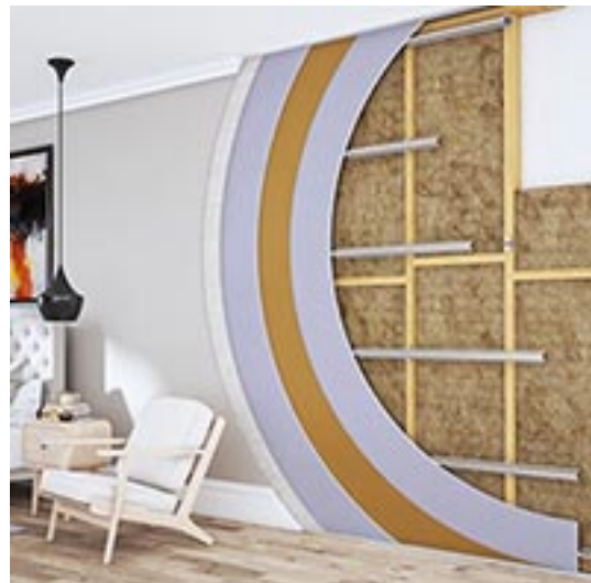
Veggkledning med skinner med festebeleg, gips, Tecsound og ny gips.