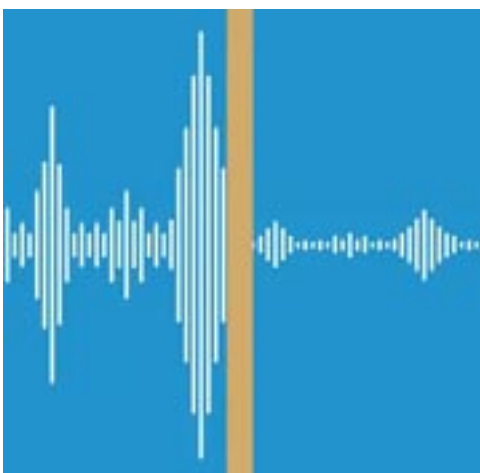
Vibrasjons-reduksjon, effekt av Tecsound